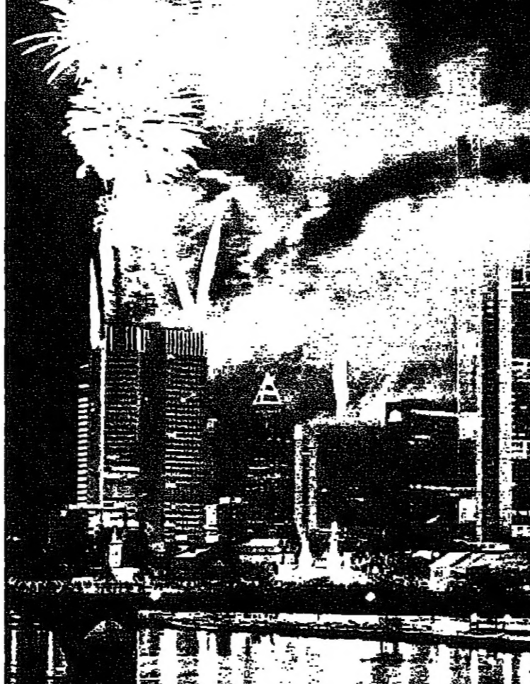
حي اللال في وسط مدينة فرانكفورت الألمانية تصبى الامطار الغزيرة التي اطلقت النملة قبل الفاشلة فوق ساحات السحاب الموجودة فيه بنهاية يوم الثلاثاء السحاب، التي فتحت أبوابها للجمهور طيلة يوم السبت

شركة الاسكندرية للحديد والصلب تصدر مليوني سهم لرفع رأسمالها: القاهرة-رويترز: قالت شركة الاسكندرية الوطنية للحديد والصلب امس الأحد انها سترفع رأسمالها عن طريق طرح مليوني سهم لكون اولوية الاكثاب فيها للمساهمين الحاليين في الشركة. وجاء في اعلان للشركة نشر امس ان طرح الاسهم سيرفع رأسمالها من 1.2 مليار جنيه مصري (350 مليون دولار) من مليار جنيه مصري.